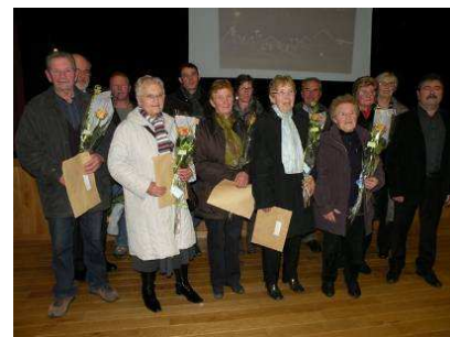
Les lauréats, lors de la remise des prix

Encore Bravo aux différents lauréats du concours des maisons fleuries.