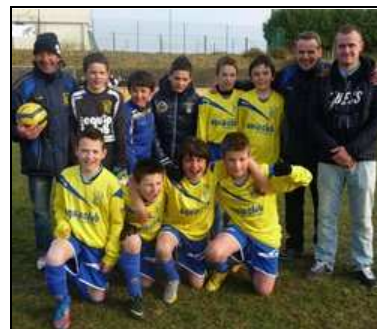
Les U13 de Milizac, vainqueurs en 2013

Un chapiteau de 200 m 2 permettra aux personnes présentes de se restaurer dans de bonnes conditions.