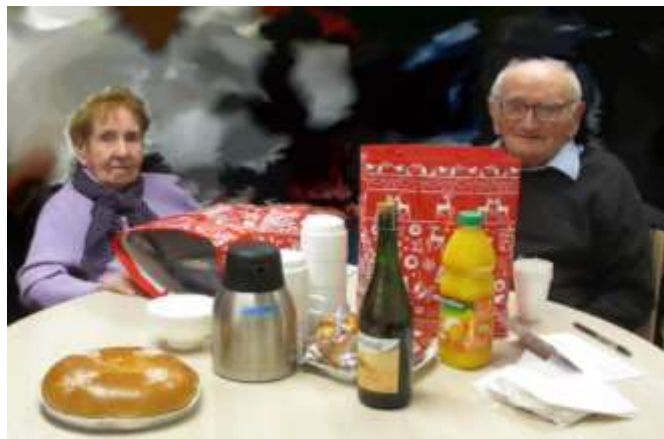
Vœux du CCAS aux anciens (2017)