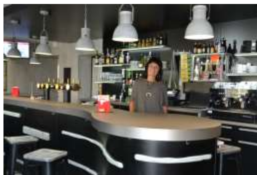
MiliZinc - 141 rue Général de Gaulle ☎ 02 98 07 98 72

Le MiliZinc : Bar, PMU, tabac, presse, loto, timbres fiscaux, relais pick up (colis) et bientôt cartes grises, prochainement habilité pour des paiements de factures dotées d'un code barre spécifique destiné aux centres de finances publiques (impôts sur le revenu, taxes foncières, taxes habitation, cantines, crèches, hôpital...).